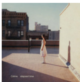
celine Here And Now Attendre