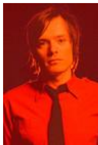
Darkel Be My Friend

Dirty Nightgown Miss Teardrop Whistling in Tongues